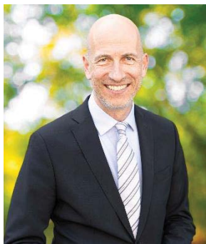
Univ.-Prof. Dr. Martin Kocher

Das Jahr 2022 hat uns erneut vor viele Herausforderungen gestellt. Konzentrierten sich unsere Anstrengungen Anfang des Jahres noch darauf, die COVID-19 Pandemie so erfolgreich wie möglich zu bewältigen, löste der russische Angriffskrieg gegen die Ukraine zusätzlich zu unermesslichem menschlichen Leid weitere schwerwiegende Krisen aus. Zusammenhalt und europäische Solidarität sind für die Bewältigung der Auswirkungen dieses Krieges von entscheidender Bedeutung. Daran müssen wir weiterhin gemeinsam festhalten.