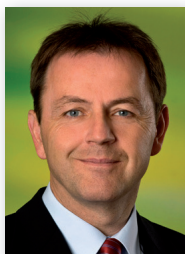
Niki Berlakovich Landwirtschaftsminister

Sie soll ländlich, engagiert und außergewöhnlich sein, eine Frau mit Vorbildcharakter für andere Bäuerinnen – diese Frau suchen wir. Dafür schreiben wir den Wettbewerb „LEA – Die Bäuerinnen des Jahres 2010“ aus. Ich will mit diesem Wettbewerb das Berufsbild „Bäuerin“ stärken. Das hohe Ansehen des Berufs soll weiter gesteigert werden. Bei all jenen, die daneben die Kraft und Zeit aufbringen, neue Ideen zu entwickeln, die den Betrieb stärken, möchte ich mich bedanken. Als Zeichen meiner Wertschätzung habe ich diesen Wettbewerb ins Leben gerufen, der die Leistungen der Bäuerinnen in den folgenden 3 Kategorien würdigt: