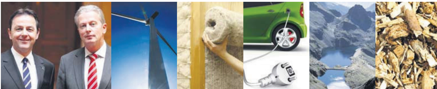
DI Nikolaus Berlakovich, Umweltminister und Dr. Reinhold Mitterlehner, Wirtschaftsminister