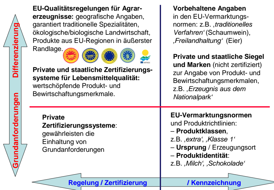
Schaubild 1. Qualitäts- und Zertifizierungsregelungen sowie Vermarktungsnormen

Zertifizierung wie Etikettierung können dokumentieren, dass ein Erzeugnis bestimmte Grundanforderungen erfüllt. Beide können darüber hinaus auch eine höhere Qualität - durch Produktmerkmale oder Bewirtschaftungsmerkmale - bescheinigen.