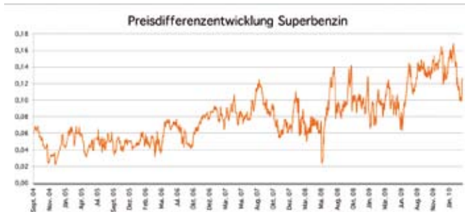
Abbildung 1: Preisdifferenz SuperBenzin an Nicht-Autobahn- und Autobahntankstellen in Österreich