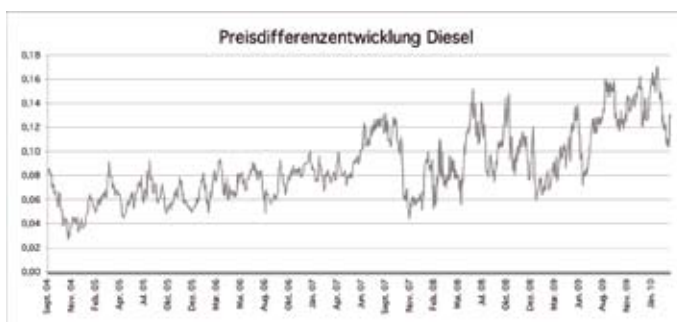
Abbildung 2: Preisdifferenz Diesel an Nicht-Autobahn- und Autobahntankstellen in Österreich