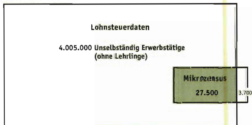
Grafik 36: Unselbständig Erwerbstätige (ohne Lehrlinge) 2011 Lohnsteuerdaten x Mikrozensus

Die Schnittmenge LSt x MZ besteht somit aus allen unselbständig Erwerbstätigen (ab 15 Jahren mit Wohnsitz in Österreich, ohne Lehrlinge), die im Bezugsjahr in mindestens einem Quartal im Mikrozensus befragt und im Verknüpfungsvorgang in den Lohnsteuerdaten gefunden werden konnten (vgl. Grafik 36).