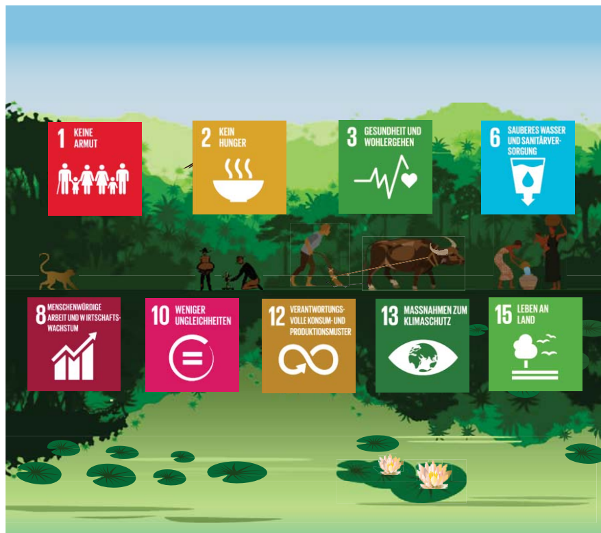
Abbildung 1 – forstwirtschaftliche Güter und Dienstleistungen zur Unterstützung der Ziele der Vereinten Nationen für nachhaltige Entwicklung

Weitere EU-Maßnahmen zum Schutz der Wälder stünden mit internationalen Übereinkommen und Verpflichtungen im Einklang, mit denen voll und ganz anerkannt wird, dass ehrgeizigere Maßnahmen notwendig sind, um den Trend der Entwaldung umzukehren. Das Klimaschutzübereinkommen von Paris und der globale Strategieplan für die biologische Vielfalt 2011–2020, der im Rahmen des UN-Übereinkommens über die biologische Vielfalt angenommen wurde, sowie die Biodiversitätsziele von Aichi fördern die nachhaltige Waldbewirtschaftung, den Schutz der Wälder und die Bemühungen zur Wiederherstellung. 14 Die Verringerung des Waldverlusts und der Waldschädigung ist eine Priorität im Rahmen des strategischen Plans der Vereinten Nationen für Wälder 15 . Die Verstärkung der Bemühungen um eine nachhaltige Bewirtschaftung der Wälder ist auch für die Agenda 2030 der Vereinten Nationen für nachhaltige Entwicklung von zentraler Bedeutung, da Wälder eine multifunktionale Rolle spielen, die die Verwirklichung der meisten Ziele für nachhaltige Entwicklung unterstützt.