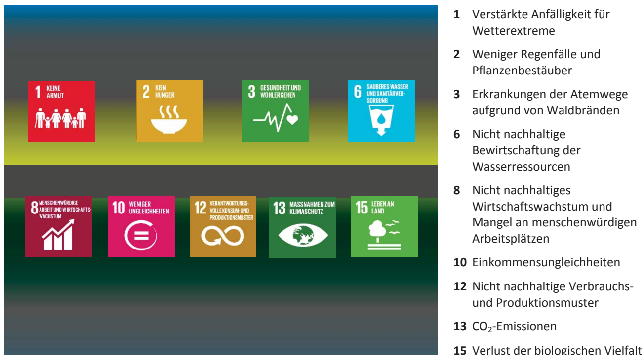
Abbildung 2 – Auswirkungen der Entwaldung auf die Ziele für nachhaltige Entwicklung