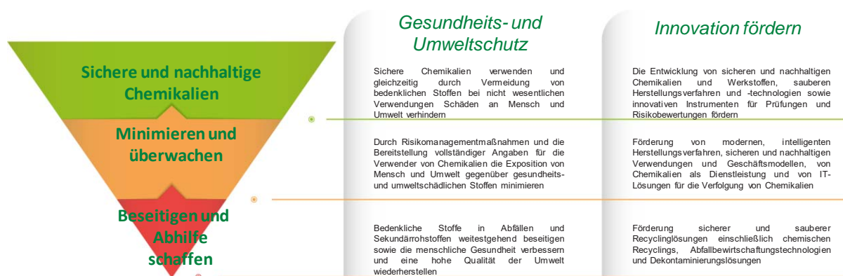
Abbildung: Die Hierarchie der Schadstofffreiheit – eine neue Hierarchie beim Chemikalienmanagement

Verwirklichung einer schadstofffreien Umwelt ab, was bedeutet, dass Chemikalien so hergestellt und verwendet werden, dass ihr Beitrag zur Gesellschaft – einschließlich zur Verwirklichung der grünen und der digitalen Wende – maximiert wird, ohne dem Planeten sowie derzeitigen und künftigen Generationen zu schaden. Die EU-Industrie soll sich bei der Herstellung und Verwendung von sicheren und nachhaltigen Chemikalien zu einem wettbewerbsfähigen, weltweiten Spitzenreiter entwickeln. In der Strategie werden ein klarer Fahrplan und Zeitplan für die Umstellung der Industrie mit dem Ziel vorgeschlagen, Investitionen zu mobilisieren und in sichere und nachhaltige Produkte und Herstellungsmethoden zu kanalisieren.