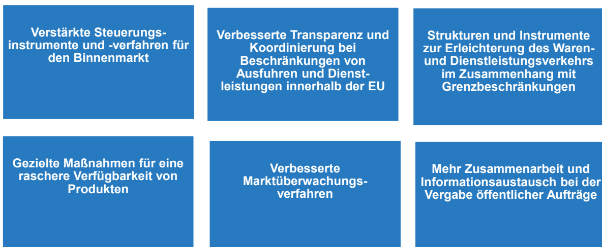
Abbildung 2 Kernelemente des Notfallinstruments für den Binnenmarkt